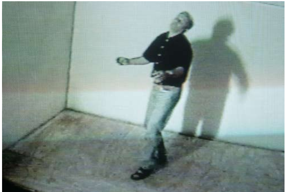
Observer, La Criée, Rennes, 2000